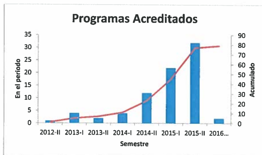
Figura 1 Acreditaciones otorgadas por semestre y acumuladas hasta febrero del 2016