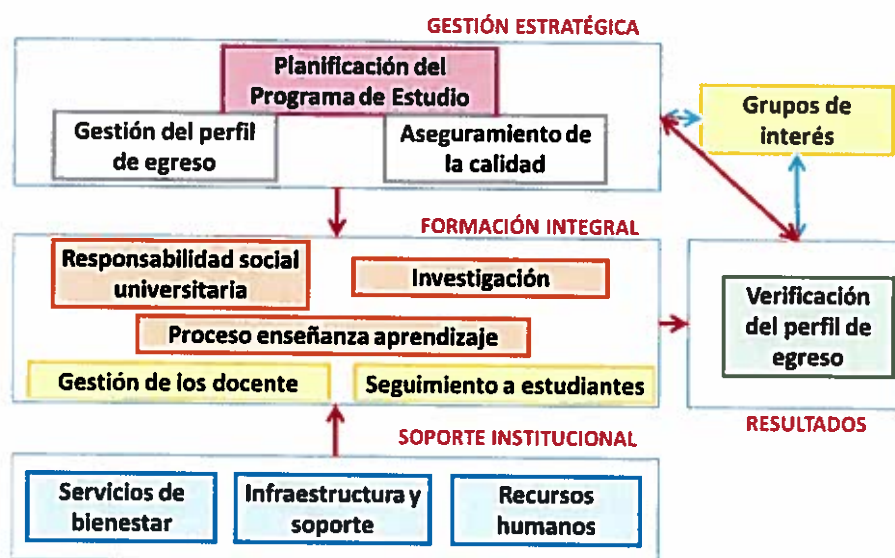
Figura 4: Relación de dimensiones y factores del modelo de acreditación de programas de estudios universitarios