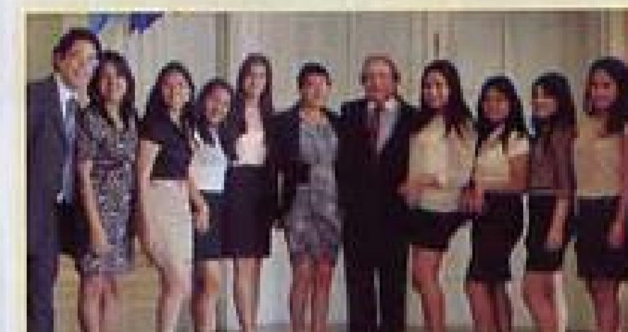
La Delegación de la Universidad Nacional de Trujillo con el Jefe de la Misión Permanente del Perú ante la OEA.