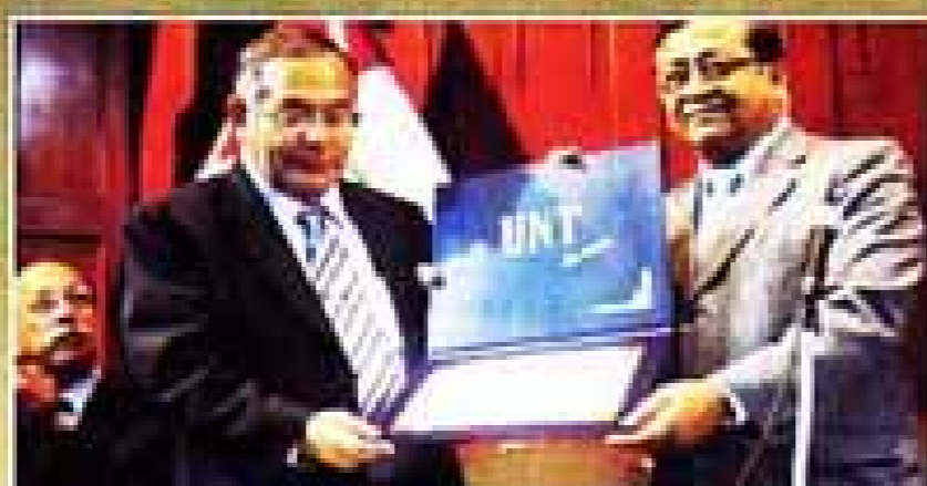
Presidente del Consejo Nacional de la Magistratura.