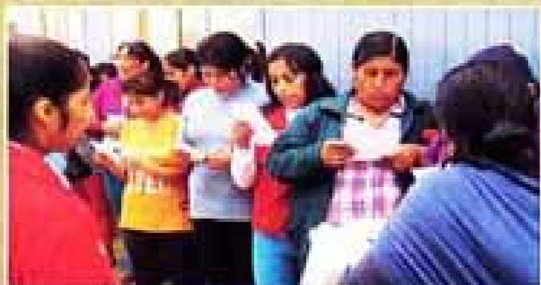
La Ley y lo social