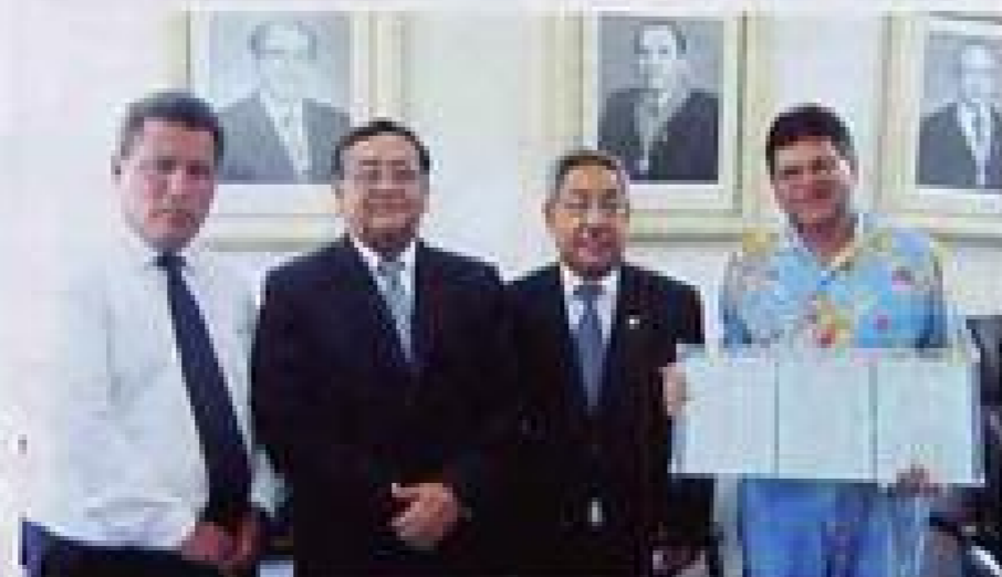
Acto y documentos de institucionalización.