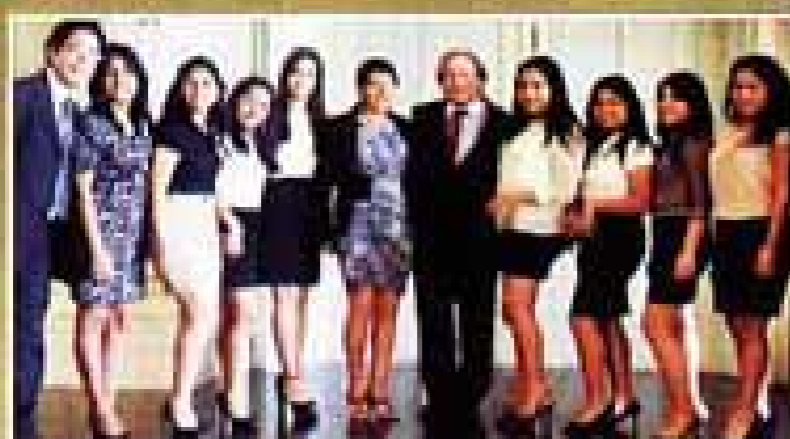
Calidad académica de exportación.