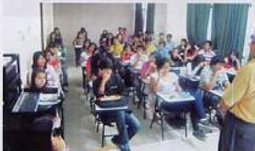
Bienvenida a las aulas.