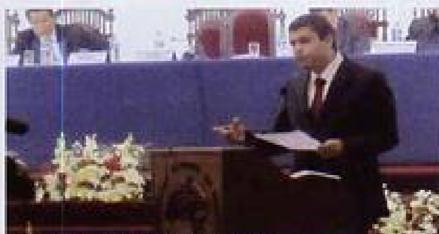
Congresista Santiago Gastañadú Ramírez

En la audiencia los ciudadanos participaron en este proceso de consulta e hicieron llegar y exponer sus inquietudes hacia las fuentes directas del Congreso.