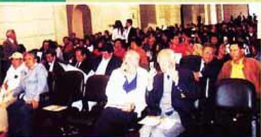
Presencia y trascendencia en la historia y en la sociedad.